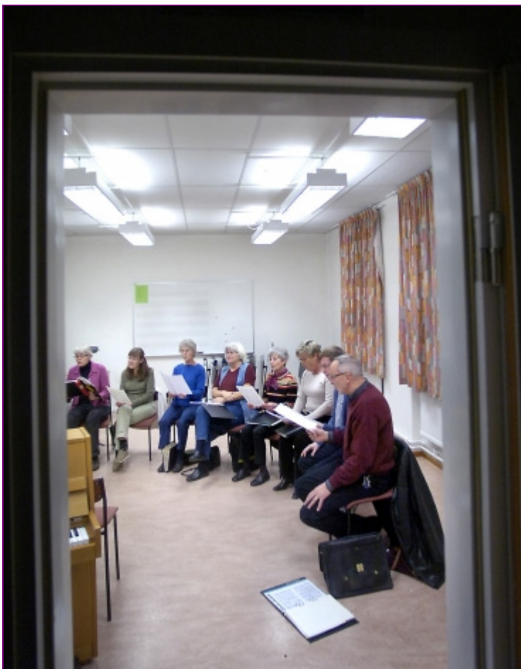
Körövning pågå. En vanlig onsdagskväll.